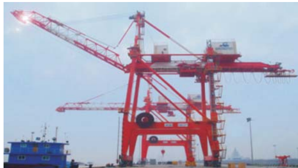
起重行业大型机械制动 Large mechanical brake lifting industry