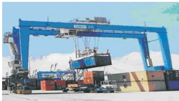
港口机械 Port Machinery