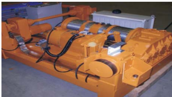
电机启动、制动、调速 Motor starting, braking, speed