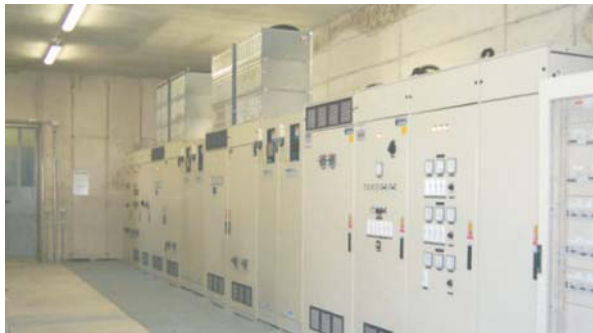
变频制动 Inverter Brake